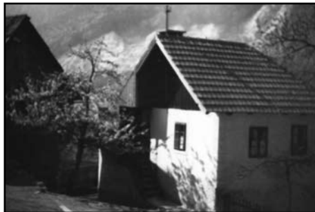
Mlinarjeva domačija po obnovi leta 1955

Hiša pri Mlinarju naj bi bila zgrajena sredi 19. stoletja. Prvotno je bila hišna številka Jesenice 56, ki se je kasneje preimenovala v "Na Murovi 11". Ker je bila potem na Murovi zgrajena le ena nova hiša (pri Razingerju), je naša hiša dobila številko Murova 12. Mlinarjeva domačija stoji na stičišču Kosove ulice in poti, ki poteka skozi Murovo oziroma je postavljena vzporedno in tik Kosove ulice, ki je bila kasneje z zasutjem prekinjena. Kosova ulica pa je nekdanja rudarska pot, po kateri so vozili rudo od Savskih jam. Na Murovi so vse hiše razen naše postavljene v smeri doline, od vzhoda proti zahodu.