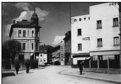
Pogled na mesto Jesenice okoli leta 1940