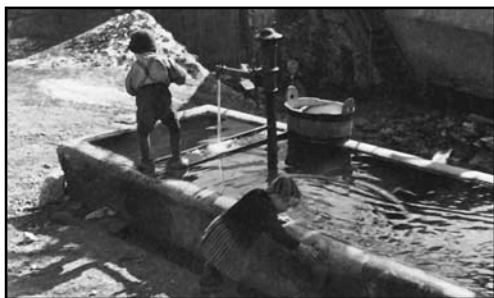
Pri vodnjaku Na klancu

Pred drugo svetovno vojno so bili nastavljeni upokojeni delavci, da so vzdrževali vse gozdne poti po Mercu, zato ni bilo nikdar nevšečnosti zaradi nalivov od dežja. Na Murovi je skoraj vsaka hiša imela živino: eno do dve kravi, vola za vprego, prašiče in kure. Skoraj vsaka hiša je imela rovt ali tal za sečnjo trave, seno pa so dovažali z