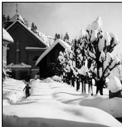
Cerkev na Murovi pozimi leta 1930

V hudih zimah, ki včasih niso bile redke, se je zgodilo, da je zapadlo tudi do meter in pol snega. Zaradi nizkih hiš in majhnih oken se je videlo le noge mimoidočih. Z rokami si se lahko dotaknil ganka, katerega spodnji rob je sicer dva in pol metra nad cesto. Neredko so v takih zimah prišle iz gozda prav do hiše srne in se zaradi snega niso nič bale ljudi. Žival čuti, kdaj ji je človek potreben. Tudi kakšna lisica je včasih prišla do hiš tako nemoteno, da bi jo lahko prijel za njen košati rep, če bi ne bila stekla.