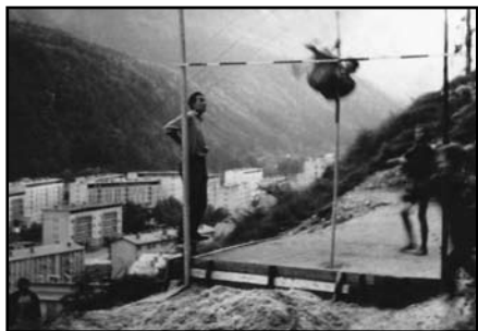
Murovske igre leta 1964 (Franci Šranc)

Nogomet smo igrali na oddaljenem travniku. Poleti 1964 smo otroci pod gozdom, imenovanim mali Cikel, s prostovoljnimi delom uredili velik prostor za trening atletike in tam organizirali murovske igre, v okviru katerih smo tekmovali v skoku