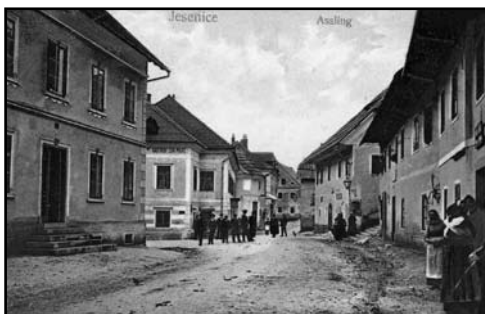
Razglednica Jesenic iz leta 1907 Na skrajni levi stoji Furvova hiša. (Dušan Prešern)