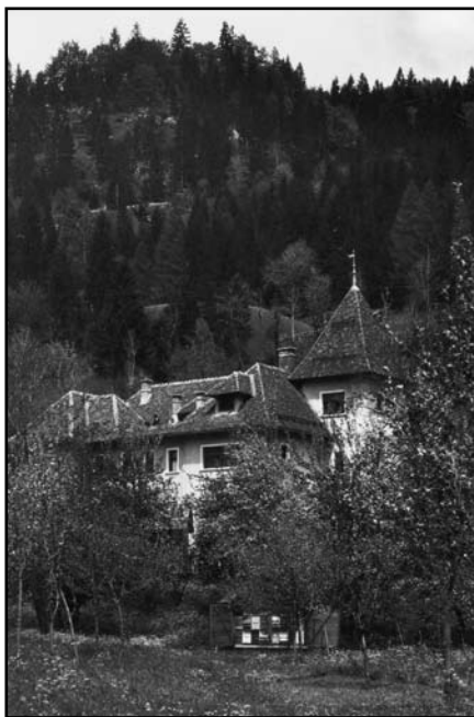
Čufarjev gradič na Jesenicah v tridesetih letih 20. stoletja

Spominov še in še, preveč, da bi lahko vse opisal. Večinoma so lepi, kot je bila lepa moja mladost, ki sem jo preživeljal na Murovi. Zato se z nostalgijo spominjam teh časov. Kako drugačni so bili in kako drugačen je bil ta svet, svet "moje Murove", svet "mojih Jesenic". Kako topel in varen. Kako ranljivi pa smo postali danes v tem globaliziranem, tehnično tako razvitem, čustveno in duhovno pa tako plitvem in praznem svetu.