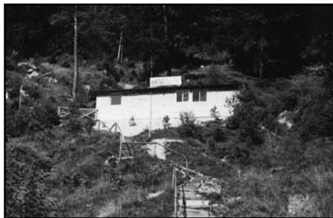
Mini hala po odprtju leta 1970 (Franci Šranc)

Objekt smo gradili celo poletje in to kar sami s prostovoljním delóm. Mini halo smo slavnostno odprli 22. avgusta 1970 in tako končno dočakali svoj prostor za igranje. Pozimi istega leta smo uredili še notranjost in nabavili plinsko peč, da smo lahko igrali tudi v mrazu. Priredili smo tudi silvestrovanje za vse krajanje. Leta 1972 smo dogradili še garderobo in močnejšo streho. Ker je bilo za delovanje