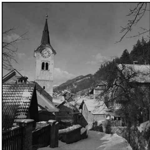
Cerkev na Murovi leta 1981