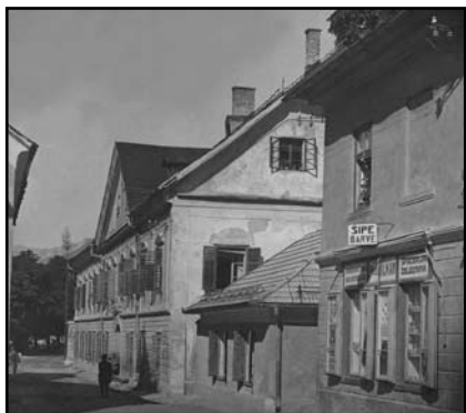
Vilmanova trgovina na Stari Savi