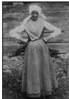
Thalerjeva Meta pred Šadrnikovo domačijo (Andreja Svetina)