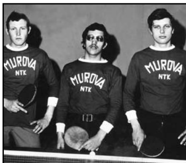
Ekipo Murove na prvi uradni tekmi leta 1971 v Mini hali