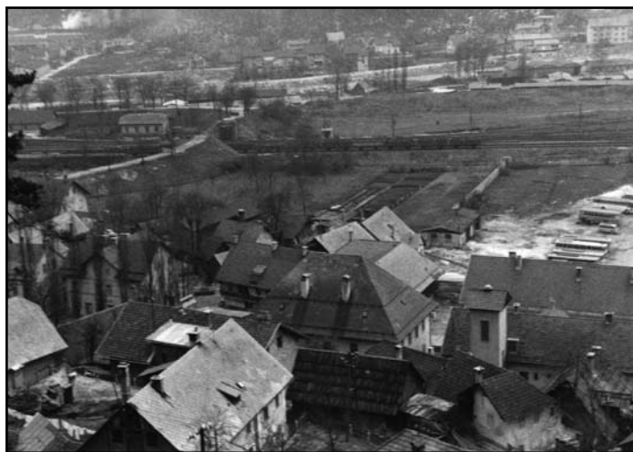
Pogled na Murovo s Kosovo graščino in gasilskim domom okoli 1955 (Anton Ravnikar)

Tako se spominjam življenja in dela pri Mlinarju na Murovi. Mama in ata sta mi bila za vzgled. A tega se zavedam šele danes. Marsikaj pa bi se še dalo dodati.