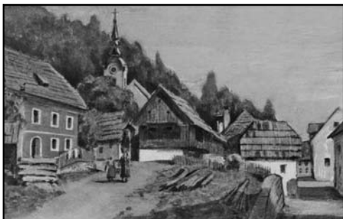
Razglednica Jesenic okoli leta 1900. Pred cerkvijo stoji mala Ambruževa hiša.