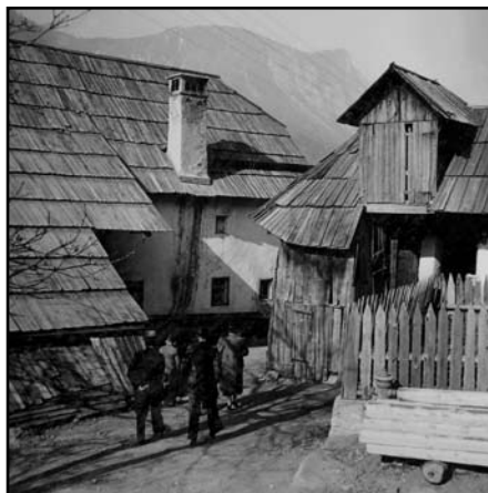
Matijevčeva domačija okoli leta 1930