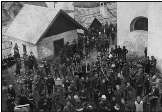
Velikonočno ragljanje (Zvonka Petrovič)

Vsak si je moral nabaviti tudi lesen kol, najboljši je bil bukov, da so potem po končanih molitvah z njimi udarjali po zabojih. Te so razcefrali skoraj v drobne trske. Pripravljene so bile tudi vseh vrst raglje. Največja je bila cerkvena, ki je imela stalno