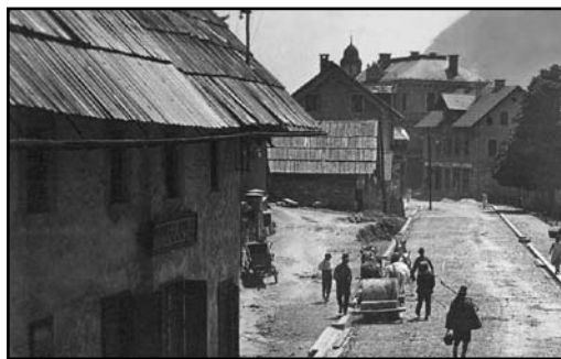
Jesenice leta 1929