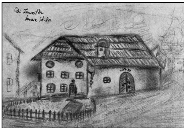
Pri Lenartku`na Murovi št. 80 (Risba Antona Žerjava, last Zvonke Petrovič)

še danes. Ob naseljevanju Murove oziroma Starih Jesenic je marsikateri otrok ob krstu dobil ime po farnem patronu, to je Lenartu. Tako je tudi gospodar mojega današnjega doma dobil ime Lenart, hiša pa staro domače ime Pri Lenartku. Vseh starih hišnih imen bi po naseljih Murove in Stare Save še v današnjem času lahko našteji preko petdeset.