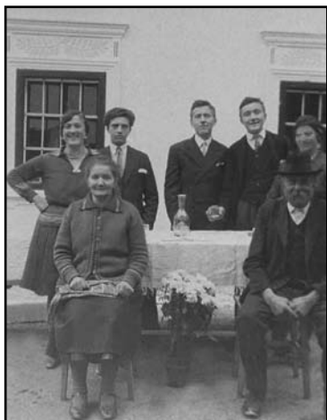
Murovčani okoli leta 1930