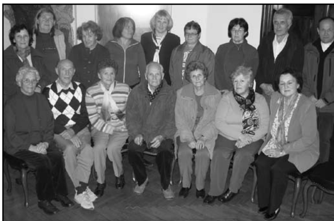
Udeleženci študijskega krožka 2010 v Kosovi graščini na Murovi

Nič boljši fantje niste vi, Še mlečnih zob pa se kadi, vi pijte vin pa šnops pa pir pa hodi s frajlami na špencir tja v Milanov gaj, tam prijetno je sedaj, tam nobenega ni, narava pa molči.