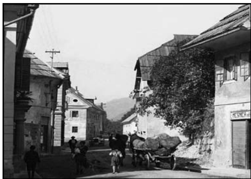
Furanje lesa skozi Jesenice

žaganje in predvideno sušilnico ter pralnico. V pritličju je ročna delavnica za šest mizarjev, žaga za hlode in soba za žagarja. Leta 1937 sem poslopje v celoti nadzidal v nadstropje, preuredil podstrešni del v stanovanje s kuhinjo in tremi sobami in prostorno skladišče. Napravil sem še skladišče za 150 kubikov desk, kupil dva "drakslna". Leta 1938, ko sem jo izročil sinu Andreju, je bila cela žaga ocenjena na vrednost 1000 000 din.