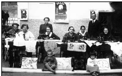
Šiviljski tečaj družbe Pfaff v tridesetih letih pri Balohovi hiši