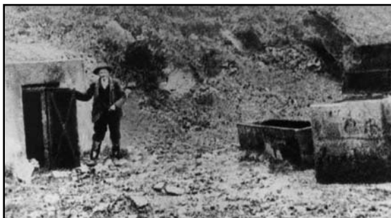
Gradnja vodnega zbiralnika nad Murovo