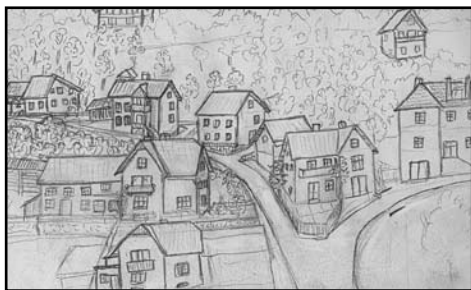
Hiše ob cesti v Planino pod Golico (Risba Franca Pšenice, last Marice Kalan)

Pri nas se je začela tudi Murova. Prva hiša je bila Čufarjeva vila, kjer so stanovali Mencingerjevi. Sinova Gusti in Joža sta bila mlajša in zato nista bila v naši klapi. Pri hiši smo imeli tudi velik sadovnjak, ki je segal do zadnje hiše naše ceste, do Koblarjev, kjer je živela naša, rekli pa smo ji Koblarjeva stara mama, trije očetovi polbratje in dve polsestri. Ta sadovnjak je bil očetova