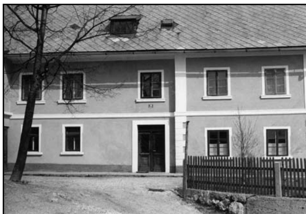
"Pr'Šafej" na Murovi v 60-ih letih 20. stoletja