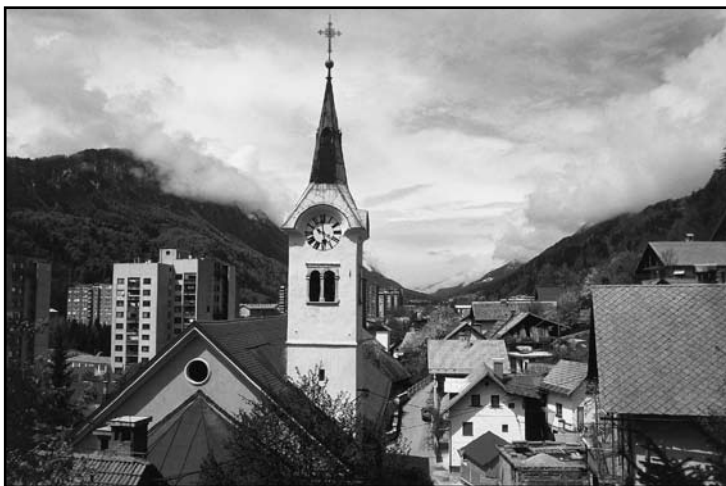
Murova s cerkvijo Sv. Lenarta 2007