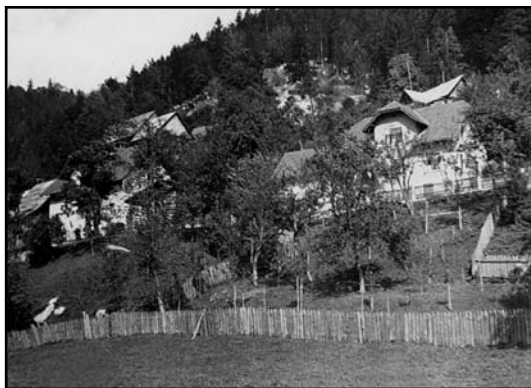
Murova s Strojovo hišo pred drugo svetovno vojno (Andreja Svetina)

posodo, na omari pa "kangla" z vodo, korec in lavor. Vodo za pitje so nosili iz Višnarjevega korita, za ostale potrebe pa iz grabna ob Strojevi hiši. Tam so tudi splakovali perilo. Milka je za ta namen pozimi obula posebne škornje iz filca, po domače "pôčne", v katere je obula še dva para volnenih nogavic, da je ni zeblo. V kuhinji je bil še "šporhet", v kotu ob oknu pa "divan" in poleg njega polvisoka omara, na kateri so za božič imeli jaslice in smrečico. Poleg naštetega je stala v kuhinji še