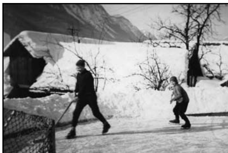
Igranje hokeja na ledeni ploskvi, kjer so poleti igrali ping pong (Franci Šranc)

Kot velika večina otrok smo se tudi mladi na Murovi dosti družili med sabo, saj takrat ni bilo televizije in druge elektronike. Poleg šole nam je takrat zapolnjevala prosti čas tudi igra in razni športi. Od športov smo najraje igrali ping pong. Na Murovi se je namizni tenis ali po domače ping pong igral že dolgo vrsto let. Igrali so ga po dvoriščih in skednjih. Najbližje so ga igrali pri Markešu, kjer so se ob igri z žogico družili domači fantje in okoliški prebivalci. Poleti pa smo stari in mladi igrali ping pong na urejenem prostoru nad požarnim bazenom. Napeljali smo tudi elektriko in tako se je igranje marsikdaj zavleko pozno v noč. To je motilo okoliške prebivalce. Ti so se vedno bolj pritoževali zaradi hrupa, ki je postajal proti večeru vse hujši. Pozimi smo na istem prostoru uredili drsališče.