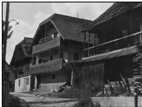
Pesjakova hiša