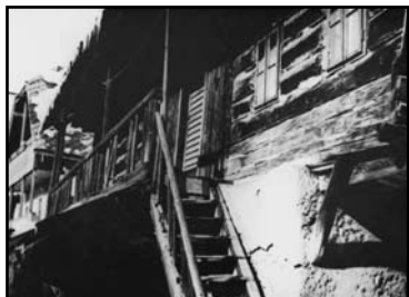
Pri Janezku na Murovi okoli 1970