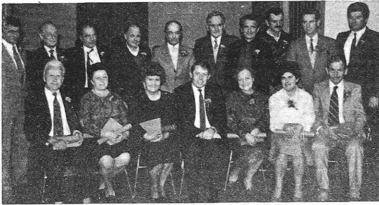
Zlati jubilaranti dela

SŽ — ŽELEZARNA JESENICE — z o. sol. o., C. železarjev 8, 64270 JESENICE