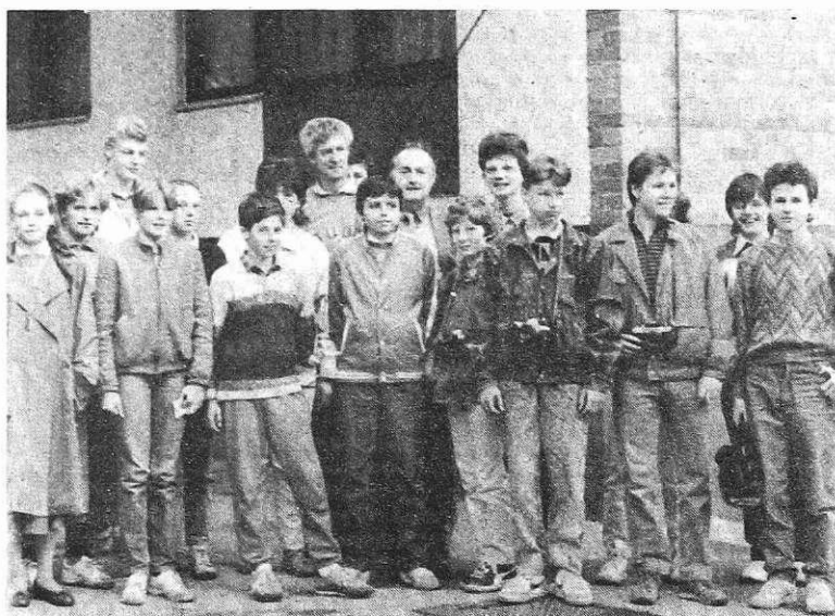
Udeleženci občinskega pionirskega foto tekmovanja na OŠ 16. december v Mojstrani

Nagrade je prispevala občinska zveza DPM Jesenice, podelili pa jih bodo v soboto, 28. maja, ob 10. uri v razstavnem salonu DOLIK na Jesenicah, ob otvoritvi medklubske razstave »Interclub Jesenice — Beljak«. Lojze Kerštan