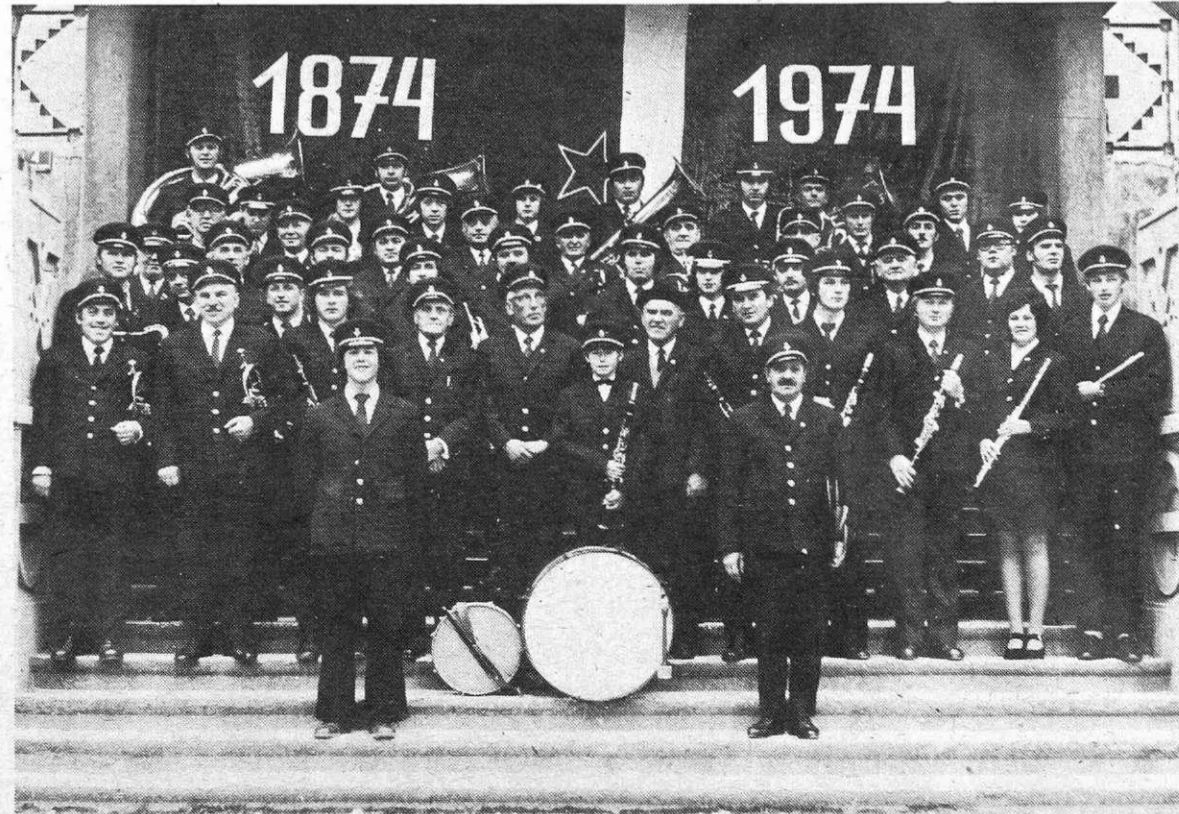
Pihalni orkester Jeseniških železarjev je letos prejel gorenjsko Prešernovo nagrado. Zapis o tem preberite na 10. strani