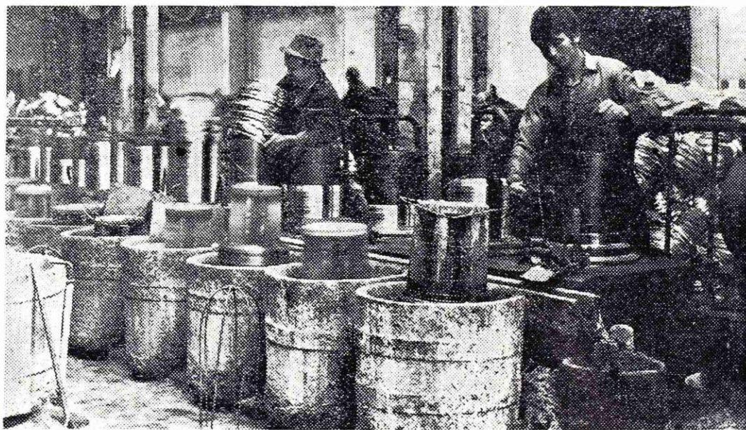
Fini vlek za pobakreno žico